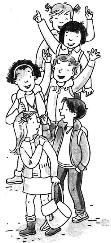
illustraties: Anita Engelen

kinderboekenschrijver en ambulant begeleider in het basisonderwijs op het gebied van gehoor, spraak en taal.